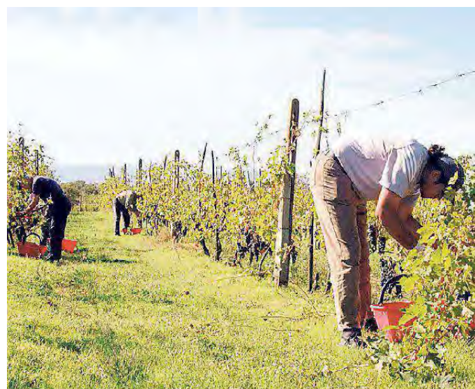
Lavoratori impegnati durante la vendemmia

L'AUMENTO PERCENTUALE DEI FINANZIAMENTI CONCESSI DAGLI ISTITUTI DI CREDITO PER L'ACQUISTO DI IMMOBILI