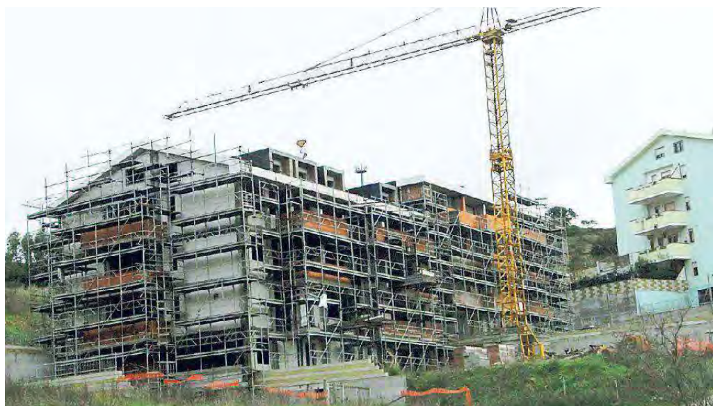
Per il comparto delle costruzioni il 2016 si è chiuso con valori negativi rispetto all'anno precedente

Il privato, nel 2016, è andato a picco, e gli appalti pubblici sono stati la metà del previsto. Il libro bianco della Cna sulle costruzioni è sempre un muro del pianto. C'è stato un altro calo dell'1 per cento nel valore della produzione, ormai appena sopra i 4,6 miliardi di euro l'anno. C'è anche un altro dato preoccupante: la produzione edilizia complessiva è stata di un milione e 600mila metri cubi, con un calo dell'84 per cento se confrontato al picco del 2002. Solo l'immobiliare ha avuto qualche sussulto, ma solo perché il mercato dei mutui bancari è stato più vivo. «L'edilizia - ha detto Francesco Porcu, segretario della Confederazione degli artigiani - continua a segnare il passo. La mortalità delle imprese è aumentata del 2 per cento e l'occupazione è scesa di altri otto punti». All'orizzonte c'è però qualche segnale di ripresa: «Sarà leggera - è la previsione di Vladimiro Sarais, vicepresidente della Cna costruzione - e dovrebbe essere trainata soprattutto dalle ristrutturazioni». Ma è dalle opere pubbliche che quest'anno le imprese si