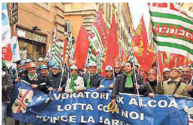
Una delle più recenti manifestazioni dei lavoratori Alcoa a Roma

che è già pronto per la due diligence. Inoltre altri operatori del settore europei stanno valutando se procedere con eventuali altre manifestazioni d'interesse. Questo quadro ci impone ancora una volta di fare bene e presto. È passato troppo tempo dallo spegnimento dello smelter e i lavoratori sono scoperti da qualsiasi forma di ammortizzatore sociale. Il ministro Carlo Calenda ci ha assicurato il massimo impegno per chiudere al più presto il percorso che porti alla cessione dell'impianto e alla sua ripartenza».